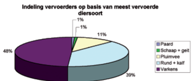
Figuur 1. Indeling van de ondervraagde dierentransporteurs op basis van de diersoort die ze het vaakst transporteren.

tig is, afgenomen. Dierentransporteurs uit de provincie Oost-Vlaanderen werden voornamelijk in de provincie West-Vlaanderen bevraagd.